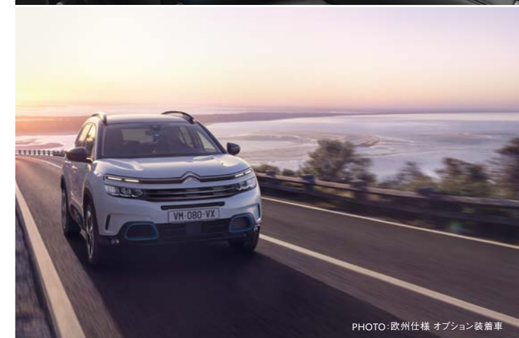
PHOTO: 欧州仕様 オプション装着車