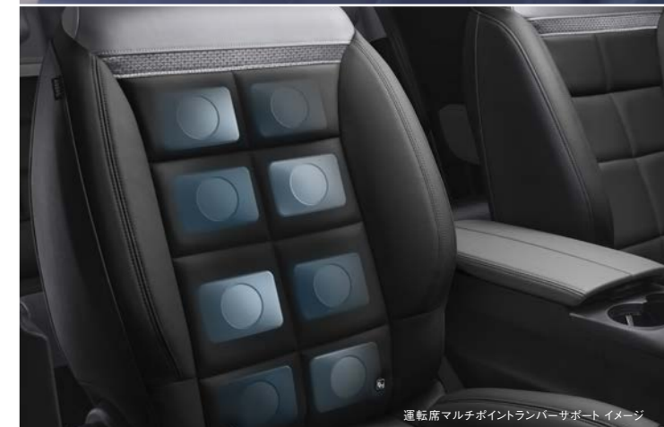
運転席マルチポイントランバーサポートイメージ