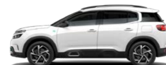
ブラン バンキーズ