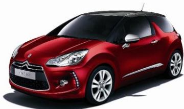
ボディカラー:ルージュ ルビ ルーフカラー:グリムーンダスト *Chic 限定色