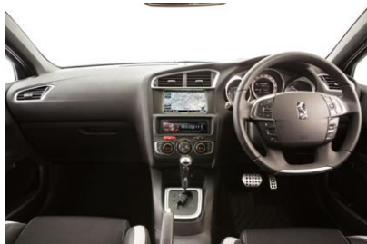
オリジナル SSD ナビゲーション