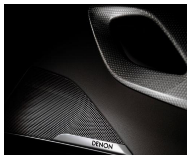
DENON HiFi システム(10スピーカー)