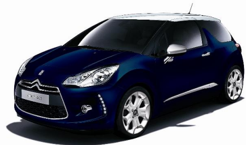
ボディカラー:ブルー アンクル(濃紺) ルーフカラー:ブラン オパール

10月4日に発売されるDS3 最新の特別限定モデル、「DS3 Leather Edition (レザーエディション)」には、本限定車専用の新ボディカラー、ブルー アンクル(仏語:ブルーインク)にブラン オパール(ルーフ)のコンビネーションを用意しました。さらにChic(4AT)にはルージュルビ+グリムーンダストの組み合わせも設定されています。特別装備としてクロームドアミラーや専用アロイホイール、インテリアではミストラル(ブラック)のレザーシート、8スピーカーのHiFiオーディオを装着し、総額25万円相当の装備を装着しながらベースモデルから5万円アップの価格に抑えました。