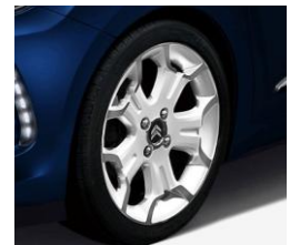
17" ツートーンブランアロイホイール *Sport Chic