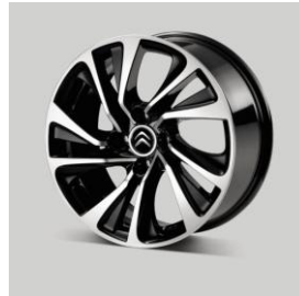
17 インチ ツートーンノアールアロイホイール