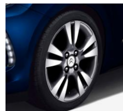
16" シルバーアロイホイール *Chic