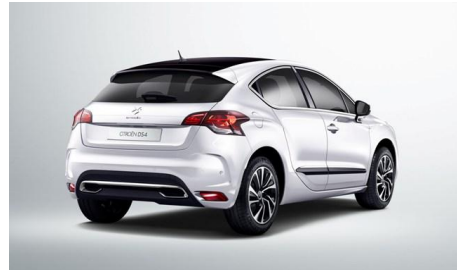
ツートーンノアールルーフ & スポイラー