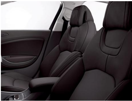
レザーシート: ミストラル