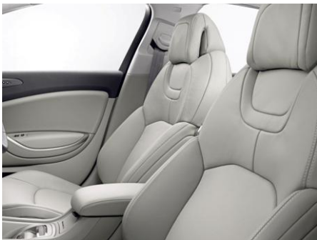
レザーシート: マチナル