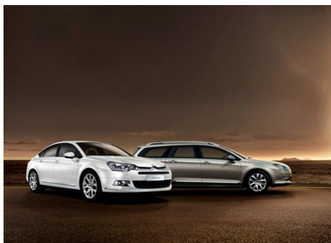
C5 Final Edition(2015)