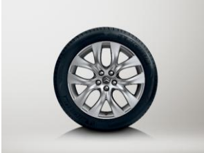
18 インチアロイ ATLANTIC (245/45 R18)