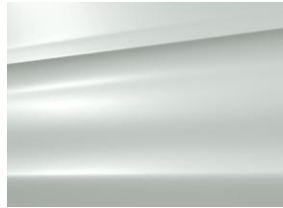
ボディカラー: ブラン ナクレ