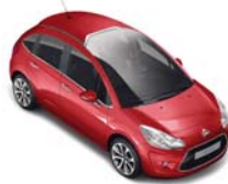
ルージュ ルシフェール