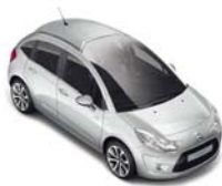
ブラン バンキーズ