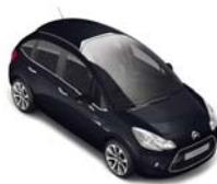
ノール オプシディアン