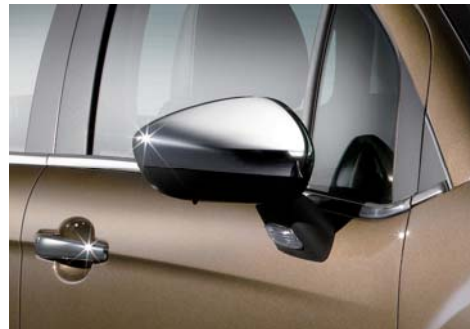
エレガントかつスポーティな印象を与える“クロームドアミラーカバー”