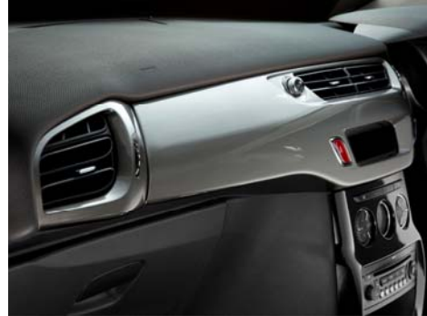
水平線を基調にデザインされた“チタンシルバーダッシュボード”