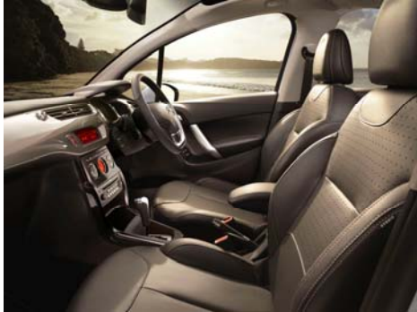
乗る人を心地よく包む上質な“ミストラル(ブラック)レザーシート”