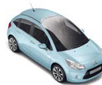
ブルー ポッティチェリ