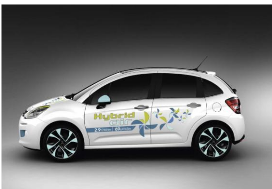
New C3 with Hybrid Air System

シトロエンの DS ラインは、発売以来 3 年間で 30 万台以上の販売を達成しました。今回、シトロエンは「DS3 Cabrio」を導入し、プレミアム市場への挑戦を続けます。ジュネーブショーでは、DS ラインから 2 つの限定車を発表します。力強いマットゴールドカラーの「DS3 Racing」、そして印象的なルックスを持つ「DS4 Electro Shot」です。そして、創造性とデザインへのこだわりを強調するため、雑誌イタリア版 Vogue for Men 誌と共同でデザインしたユニークなモデル、「DS3 Cabrio L'Uomo Vogue」も展示します。このモデルは「Women Create Life」というプロジェクトに寄付するためのサイレントオークションで売却される予定です。このプロジェクトは WHO (世界保健機関) が行っているプロジェクトで、女性と子どもの健康状態を改善する活動の支援と推進を行っています。3 月 6 日の夜、ジュネーブの WHO 本部で特別イベントが開催される予定です。