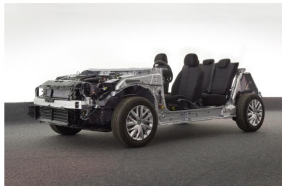
EMP2 (Efficient Modular Platform 2)