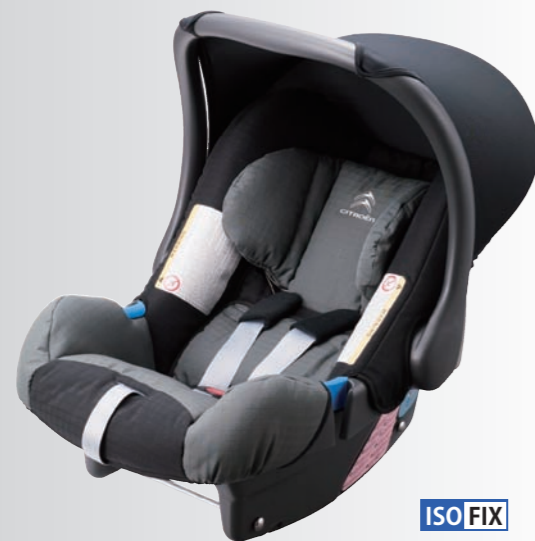
ISO FIX (別売りのISO FIX ベース使用時)

シトロエンがお奨めするチャイルドシートは、欧州の安全基準「ECE/R44」をクリアし、車のシートにカンタン・確実に取付けができる「ISOFIX」対応の製品です。 お子様の成長に合わせ、快適で信頼性の高いチャイルドシートをお選びください。