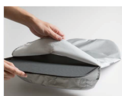
・リアドアウィンドウ サンシェードカバー

■使用方法 袋状カバーの中にサンシェード メッシュタイプを挿し込んで使用します。