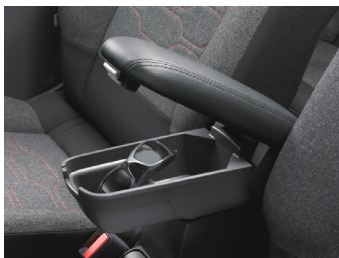
フロントセンターアームレスト