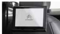
■電源起動時にシトロエンロゴを表示

※HDCP 対応機のスクリーンミラーリングは出来ません。iOS には対応していません。